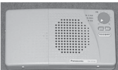
▲ 防災無線戸別受信機