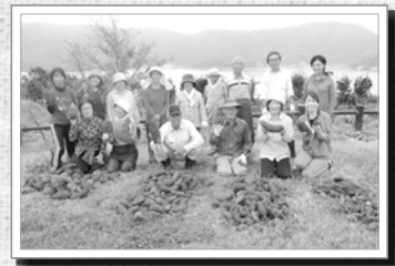
▲ ミニ牧畑プロジェクト参加者