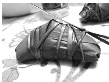
クレオ手作りの粽