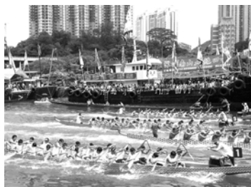
ドラゴンボートレース

粽も食べます。市販のものもありますが、私は両親と一緒に作った手作り粽(中身:つけたあひる卵の黄身、豚肉、緑豆ともち米)が一番おいしいと思います(笑)