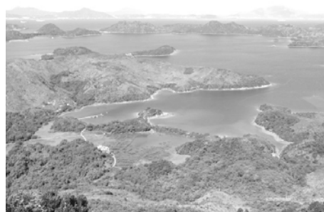
印州塘の景色 とてもきれいでしょ？

香港は林立する摩天楼のイメージが強いですが、実は西ノ島 みたいに綺麗な海と自然が見えるところがいっぱいあります！ 特に印州塘 いんしゅうとう という場所は綺麗な景色が見え、香港産の岩牡蠣も 食べることができますよ！