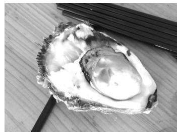
ちょっと小さいけど、 香港産の岩牡蠣ですよ！