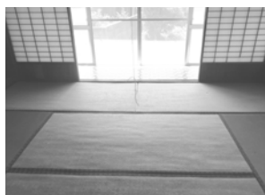
◀▲現在登録中の空き家

空き家バンクでは、希望売買価格または希望賃貸価格をはじめ、間取りや築年数、内観等の情報を見ることができます。