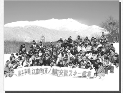
▲最後にみんなで記念撮影！