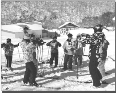
▲インストラクターの方からスキーを教してもらいました。

今回のスキー教室で第38回目の開催となりましたが、今後も江府町との交流を深め、両町の子どもたちが様々な体験ができるよう、夏の臨海学校と併せて継続していきたいと思います。