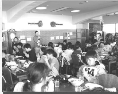
▲昼食はみんなで一緒にカレーを食べました。