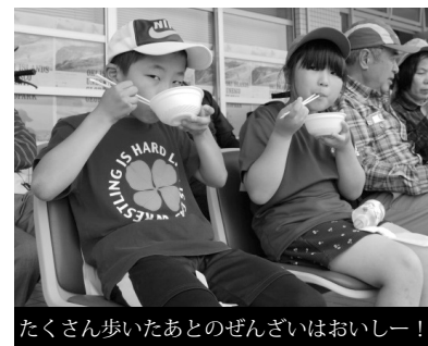
たくさん歩いたあとのぜんざいはおいしー！

子どもたちは疲れも見せず歩き、時には走り、お父さんお母さんが子どもたちのペースについていくのに必死なご家族も見受けられましたが、最後は家族揃ってゴールし、ふるまいのぜんざいをおいしくいただきました。