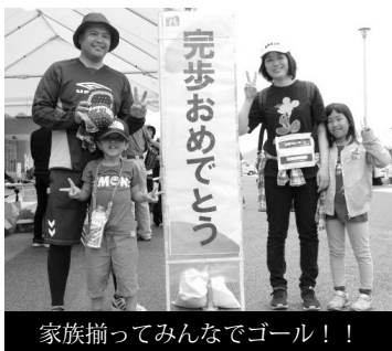
家族揃ってみんなでゴール！！