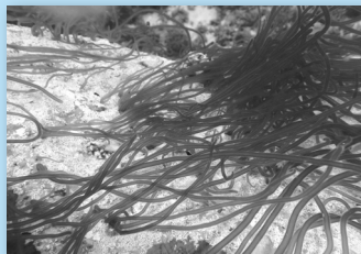
▲ウミゾウメン（写真左）と、良く似た形のアメフラシの卵（写真右）は色が黄色