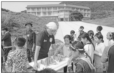
▲みんなでスイカを食べて休憩