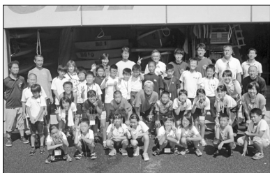
▲記念撮影 (B&G 海洋センター)