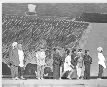
▲蒸気船の導入を喜ぶ町民たち