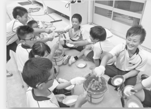
【サイエンスクラブ】 不思議に思ったことを調べます！