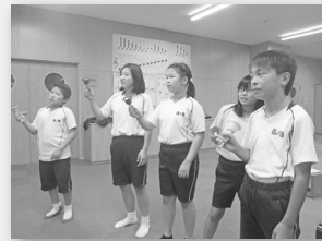
【ミュージッククラブ】 好きな曲、好きな楽器で合奏！