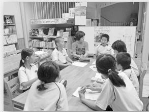
【ふるさとクラブ】 釣りや鍋ぶた踊りに挑戦！