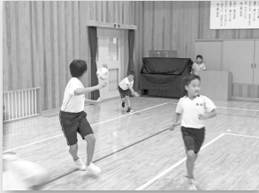
【イン&アウトドアクラブ】 スポーツ好きが大集合！

今年度は4年生から6年生まで、総勢55名が異学年集団でクラブ活動に取り組んでいます。活動の様子をご紹介します。