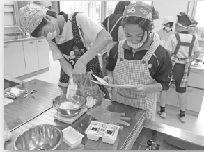
【メイキングクラブ】 お菓子作りを中心に活動！