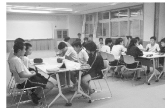
【小中学生代表者会】