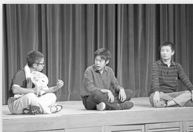
▲存続の難しさに悩む大人たち