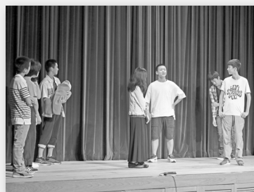
▲ふるさとに想いを馳せる卒業生