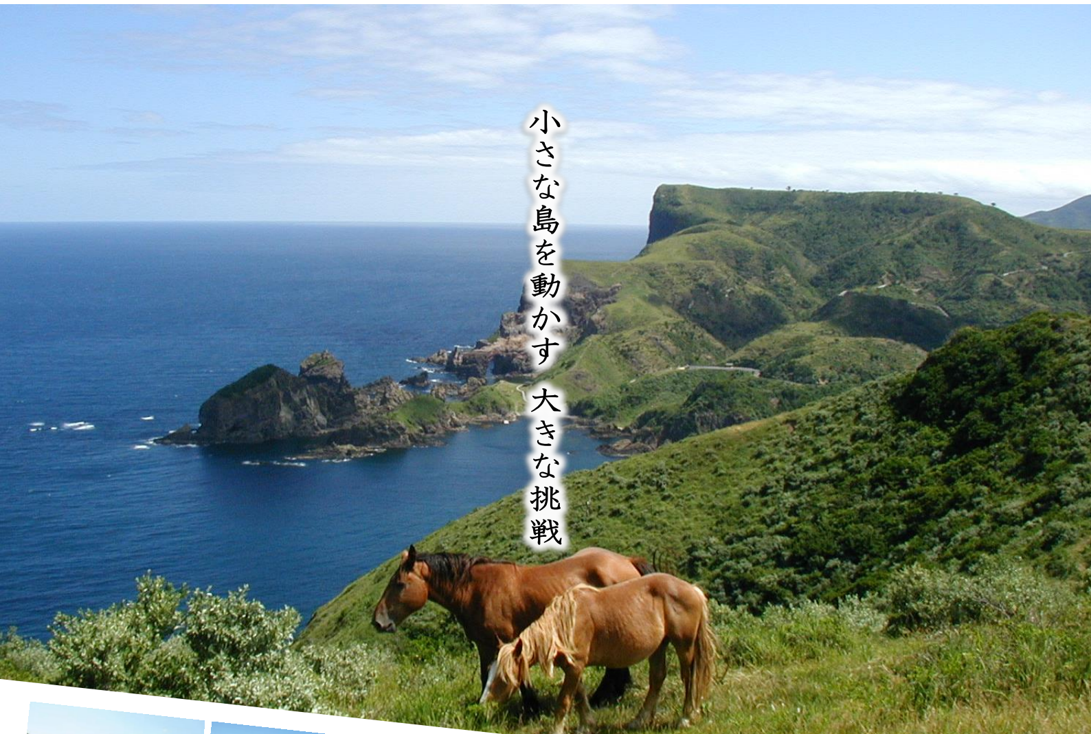
世界に誇れる絶景、国賀海岸