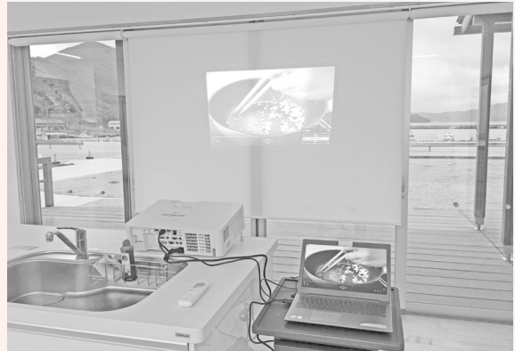
▲作り方は調理動画を見ながら説明しました

香港でよく食べられている中華料理は「広東料理」といって、主に中国の広東地方（香港、マカオ、広州など）で食べられている料理です。有名な広東料理には「ゆで海老」、「酢豚」、「ワンタン麺」、「蛇スープ」などがあります。