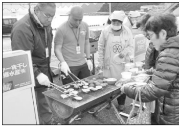
▲しいたけのバター焼き

イベント開催にあたっては、多くの皆様にご協力をいただき深く感謝申し上げます。次回は夏頃にイベントを開催したいと考えていますので、引き続き、地元食材を活かして、多くの方々に知ってもらえるよう準備を進めてまいります。