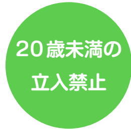
20歳未満の方は 喫煙エリアへ立入禁止に