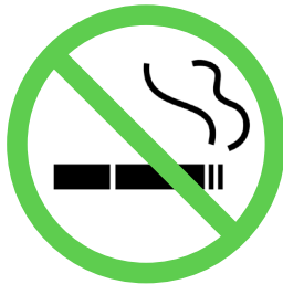
多くの施設において 屋内が原則禁煙に