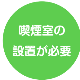
屋内での喫煙には 喫煙室の設置が必要に