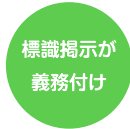
喫煙室には 標識掲示が義務付けに