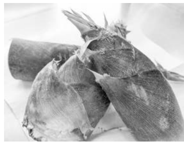
↑ 初めてたけのこを採りに行きました。意外とあっさり採れておどろき…

季節ごとに旬の食材を使って作成していく予定なので、完成はまだまだ先になりますが楽しみにしていただけると嬉しいです。