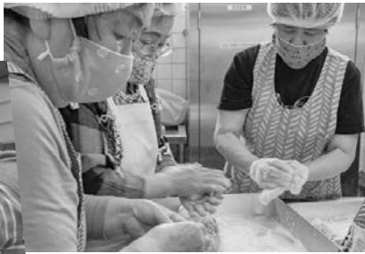
← 同時に数種類の料理をすすめていくので撮影が大変でした。大忙し！