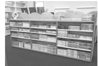
▲雑誌バックナンバー