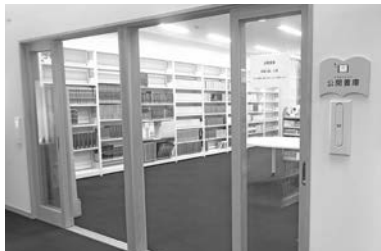
▲いかにあ屋の一番奥にある部屋です。