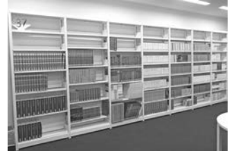
▲参考図書 文学全集▲