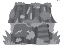
空き家戸数比較表

実施から5年を経過したこともあり、改めて集落支援員で各地区を回り、空き家の現状確認などの調査を行いました。 調査の際には、所有者様をはじめ各地区の皆様にもご協力頂き、誠にありがとうございました。