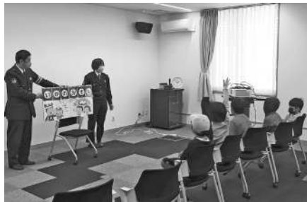
▲真剣に話を聞く子どもたち

3月19日（日）にコミュニティ図書館いかあ屋で4月から西ノ島小中学校に入学する幼児とその保護者の方を対象とした「新入生を交通事故から守る会」を開催しました。