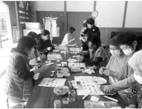
▲熱中して取り組む参加者さんたち

令和4年度は地域の方が講師となり、和気あいあいとした雰囲気です。3回のモノづくり講座を行うことができました。お世話になったみなさんありがとうございました。