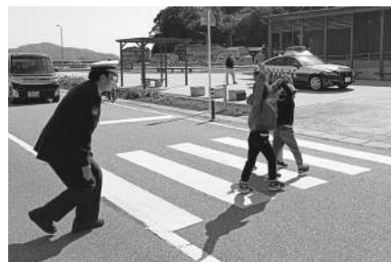
▲手を挙げて横断歩道を渡りましょう

1年生をはじめ、歩行者の安全確保のため、ドライバーの皆さんはいつも以上に優しい運転にご協力をお願いします。