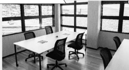
コワーキングスペース

施設について、コワーキングスペース、会議室などを整備し、コワーキングスペースは、複数の企業や個人事業主が共用して仕事をするためのスペースとなっており、交流や学習スペースとしてもご利用できますので、目的にあわせて是非ご活用ください。