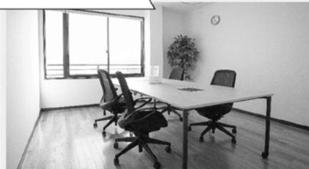
サテライトオフィス