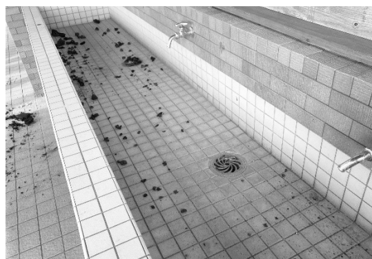
被害の様子（令和5年3月12日）