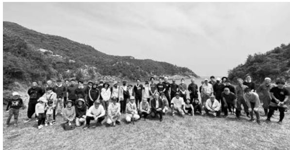
▲たくさんの方に参加していただきました

勉強会はガイドクラブに所属していなくても参加可能です。ガイドクラブでは主に、「バスガイド」や「まち歩きガイド」、「トレッキングガイド」を行っております。ガイドクラブや勉強会に興味のある方は、西ノ島町観光協会（08514-7-8888）までお問い合わせください。