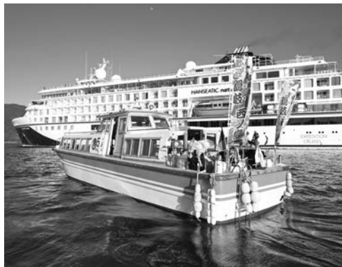
▲クルーズ客船に並走してお見送り

ドイツ人を中心に200名が乗船しており、国賀観光や焼火神社、ハイキングなど西ノ島での1日を楽しまれました。出港時には見送り船が運航され、デッキにはたくさんの乗船客が顔を出し、手を振り返すなど別れを惜しんでいました。