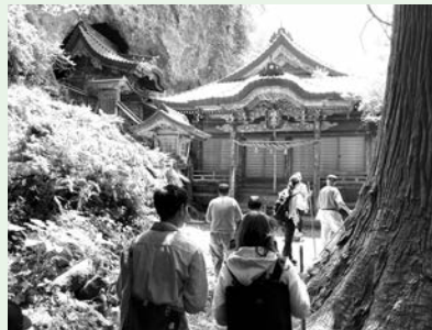
▲焼火神社での勉強会の様子

5月11日（木）にガイドクラブ（西ノ島ふるさと案内人）で「焼火神社」をテーマに勉強会を行いました。そこでの内容をまとめたものを6月19日（月）から別府港フェリー第2ターミナル2階で展示しております。1か月ほどの展示を予定しておりますので、ぜひご覧ください。 また、今後も月替わりで勉強会や展示の方を行っていく予定です。どうぞご期待ください。