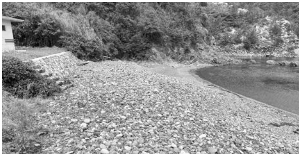
▲きれいになった耳浦海岸

耳浦はこれからキャンプ場の利用者や海水浴で賑わいますので、受入体制が整いつつでも利用可能です。ボランティアで参加くださった皆様有難うございました。