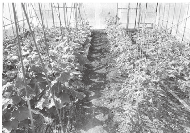
キュウリ(左)、大玉トマト・ミニトマト(右)

キ口ほど出荷を始め、生徒さん達が美味しく食べてくれる顔を楽しみに生産しています。