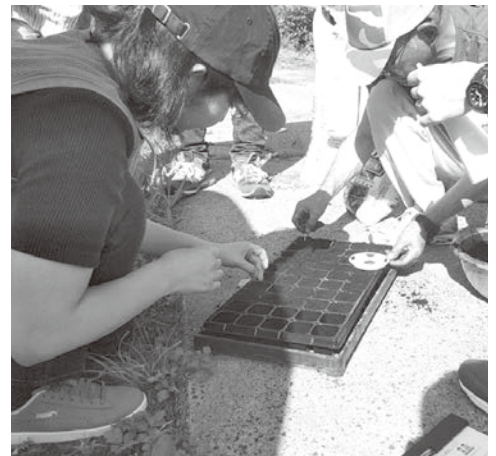
大量の苗を作るのに便利なセルトレイへ種まき