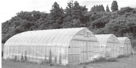
3棟のミニリースハウス

ミニリースハウスを利用されている生産者が植付した約90本のキュウリはJAグリーンストア、土曜よろず朝市へ出荷をしています。7月からは新たな試みとして学校給食にキュウリを10