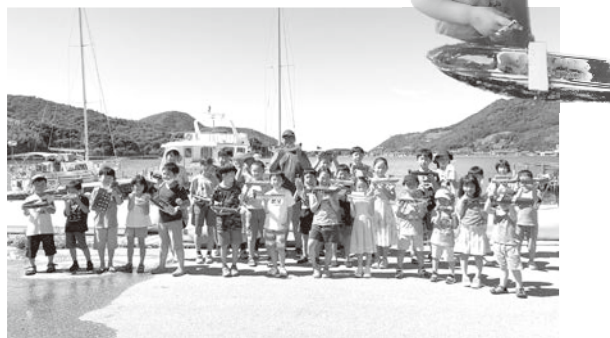
▲ たくさん子どもたちに参加いただきました