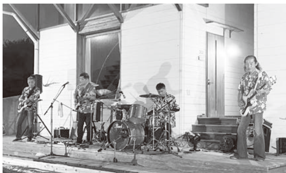
▲ アマチュアバンドコンサートの様子

6日は手作りボートによるボートレースが行われました。ボート作りでは子どもだけでなく親御さんも一生懸命船を削ったり、絵を描いたりしており、実際のレースも白熱した様子でした。今回のボートレースは地元の小学生に加え松江や出雲からの参加もあり、延べ30人の子どもたちが参加してくださいました。ご参加いただいた皆様ありがとうございました。