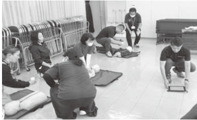
▶ 救急救命講習の様子

公民館職員、しまっこサポーター、学童スタッフ、保育士などが参加し、子どもの活動におけるリスク管理、何かが起きた場合の救急救命について学びました。