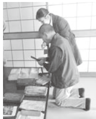
▶ 山田家文書を眺める参加者