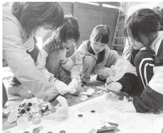
▲ プラスチックを選び並べます

を開催しました。小学1〜5年生7名の子どもたちが参加し、西ノ島の特産品であるイカをモチーフにしたアートを作りました。