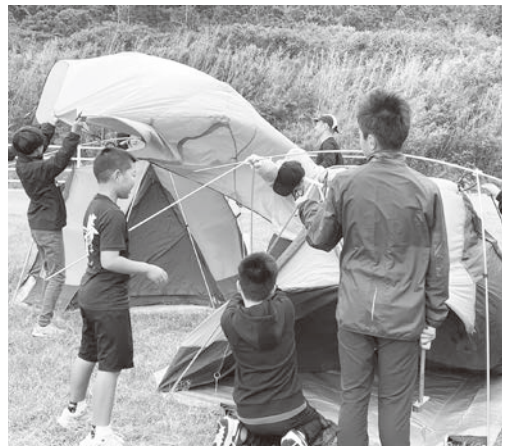
▲ 協力してテントを張ります