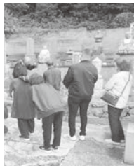
▶ 廻国記念塔の説明を聞く参加者

塔に刻まれている「天下和順」は世の中が平和であるように、「日月清明」は、自然災害の起こらないように、という意味です。昔から今日にかけても変わらない願いだということが分かりました。