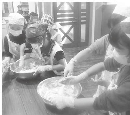
▲ 材料を一生懸命混ぜます

穫したものです。3～6年生がサツマイモを切る作業を担当し、1～2年生が材料を混ぜる作業を担当しました。皆で協力しながら作ったカップケーキの出来栄は良く、外はサクサク、中はふんわりとした食感でサツマイモの甘みも感じられ、大変美味しくできました。参加した子どもたちからは「レシピを持って帰って、家族と一緒に作りたい」と大好評でした。