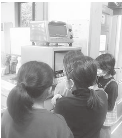
▲ 上手に焼けるかな？