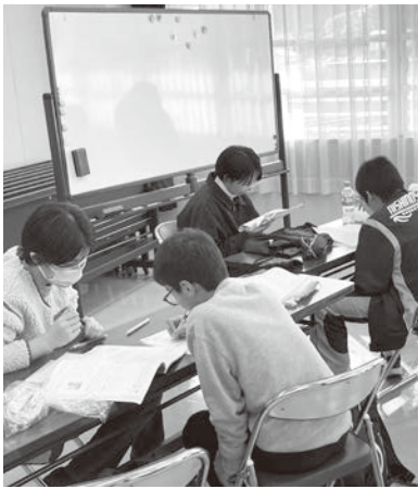
▲ 教えてもらいながら、集中して取り組みます

今年も昨年に引き続き、中学生の定期テスト勉強を大人の島留学生などの町民がサポートする自習室を行っています。