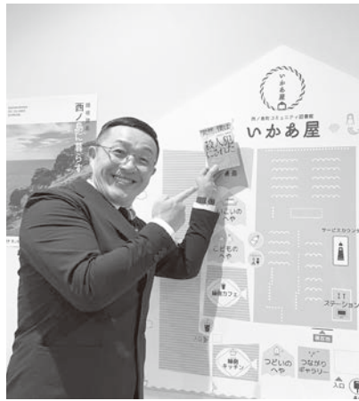
▲ 講演後、いかあ屋で著書を手

スマイリーキクチさんの著書「突然、僕は殺人犯にされた」ネット中傷被害を受けた10年間」は、いかあ屋に所蔵していますので、ぜひ読んでみてください。