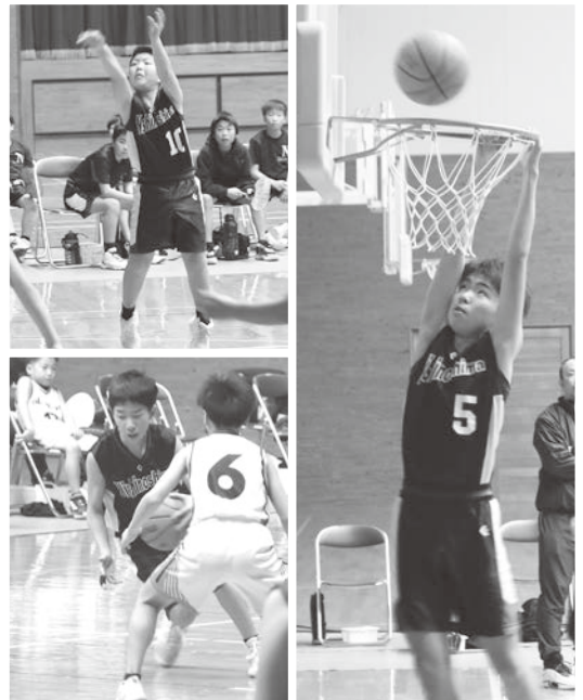
▲ 隠岐地区リーグ戦の様子