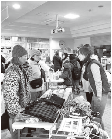
▲ 出店者同士で会話をしている様子

朝市ではリユース品を含め出店者を募集しています。お気軽に、中央公民館(6-0033)までお問い合わせください。