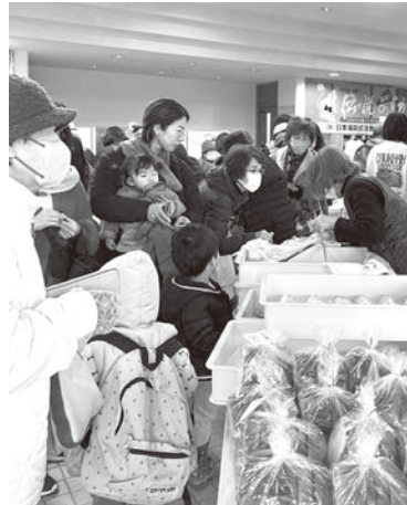
▲ 多くの来場者で賑わう会場

通常の朝市出店に加えて、家具や雑貨、食器、衣服など様々なリユース品の出店があり、たくさんの地域の方に足を運んでいただきました。ご協力いただいた皆様、ありがとうございます。