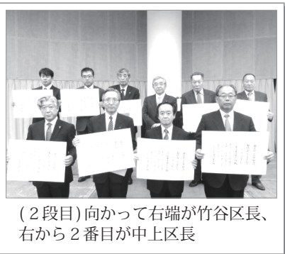
(2段目)向かって右端が竹谷区長、右から2番目が中上区長