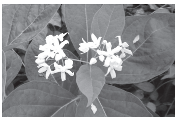
咲いている姿が珍しいクサタチバナ

高崎山には環境省レッドリストに準絶滅危惧種に指定されているクサタチバナやしまねレッドデータブックに載っているホタルカズラ、オオエゾデンダが自生しており、西ノ島の豊富な自然を目の当たりにしました。他にも西ノ島が火山島だったころの名残を示す凝灰岩があり、手で割れるほどやわらかい石質に参加者みんなで吃驚しました。