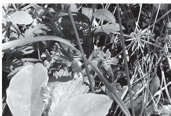
青色がきれいなホタルカズラ

昼食を頂上手前の祠近辺でとり、いよいよ山頂に向かいます。ここが一番のハイライト! 枝に付いている目印のヒモがなければ道とは分からないような斜面をひたすら登ります。