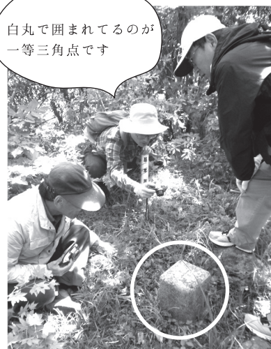
もうちょい頂上らしくても...と思うような三角点。

という訳で、最後はちょっと拍子抜けな感じで終わった高崎山登山、ケガ人が出る事もなく無事に終わられてホッとしたのでした。是非皆さんも高崎山に登ってみてくださいよ! 初夏と秋ごろがオススメだそうですよ!