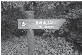
「もっと長いだろ…」by 登山参加者

少し前のお話ですが、5月17日に島根県の隠岐ジオパーク推進委員の方や、地元有志の方と口村先生の案内の元、高崎山に登ってきました。