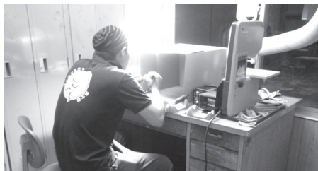
パーツをリユーターと呼ばれる研磨機で磨く

人気で現在定員数を越えた人たちが昼と夜の部に分かれて受講しています。 オリジナルのアクセサリーが制作できるということで皆さん様々な形に切り出しています。最初はお互いの作品を見て和気あいあいとした雰囲気ですが、時間が進むにつれて集中のあまり無言の時間が増えていきます。全く会話のない瞬間も珍しくはありません。