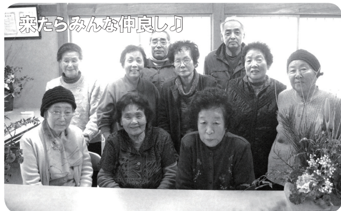
来たらみんな仲良し♪