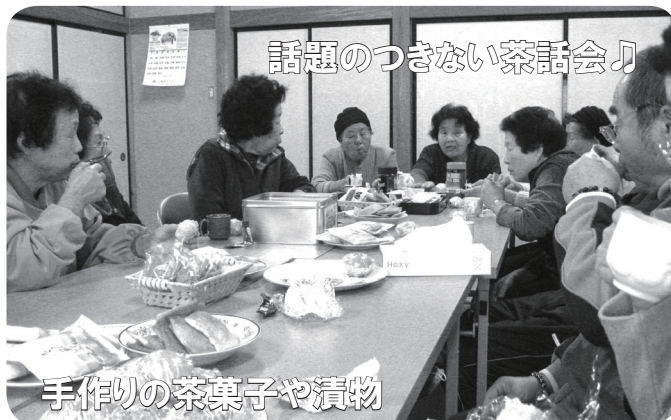
話題のつきない茶話会♪