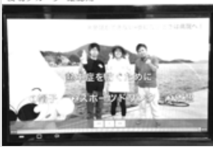
※熱中症の予防動画