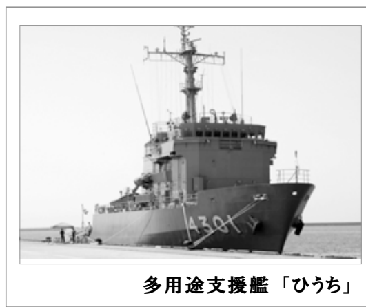
多用途支援艦「ひうち」

自衛隊島根地方協力本部 隠岐の島駐在員事務所 隠岐郡隠岐の島町中町目貫の四六1 TEL:08512-2-8351