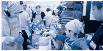
指を切らないように気をつけてね

「島の子ども達に魚をおいしく食べてもらいたい」「お母さん達が楽しく魚料理をできるような機会を作りたい」という思いで企画されたこのイベントには11家族が参加されました。