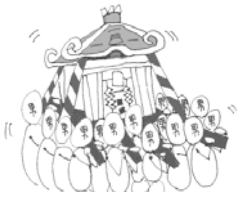
MAPに使用されるイラストたち

見よう見まねで描いたのが左のイラストたちです。Nishiさんのイラスト力に比べると足元にも及びませんが、これはこれで味があつていいでしょう…とポジティブシンキング。