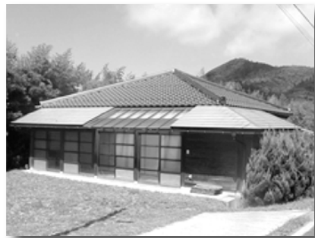
モデルハウス 西風

本土からフェリーへ渡るときの乗船時間や乗船料金、フェリーへ車を乗せていくことはできるのか、保育園や学校、商店の数、病院の診療科目、本土の病院との連携（ヘリポート設備があり、救急搬送ができるか）など、移住に意欲的な人ほど細かく質問されます。