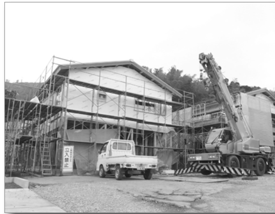
現在建設中の地域優良賃貸住宅（別府地区）

しかし、町営住宅の大半は建設後20〜40年程度が経過しているため改修工事が必要とされ、計画的に進められています。また、新たな町営住宅の建設も求められており、現在、別府地区に地域優良賃貸住宅を建設しています。 一方で、空き家や空き地が増加しており、それらの有効活用方策も検討しつつ、今年度は3軒の空き家改修を行っています。