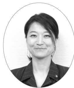
あだち しずか 議員 安達 静香