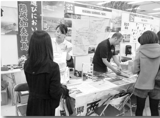
定住に関する相談風景

フェアなどでブースへ話をしに来られる方の多くは、自然の雄大な美しさに惹かれ、西ノ島町に興味を持っていたでいています。しかし、いざ移住を考えると離島というのはとても大きなハードルになるようです。