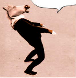
「にしこのしまの日々」 nishinoshima2.jugem.jp/