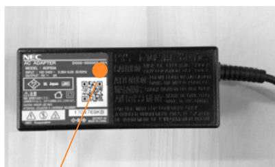
新しい電源アダプタには黄色の丸いシールが貼ってあります。