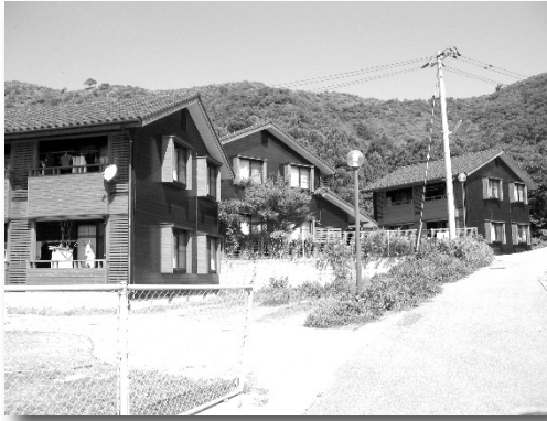
町営住宅第2 由良団地（浦郷地区）

現在、町営住宅は199戸、特定公共賃貸住宅、地域優良賃貸住宅、定住促進空き家活用住宅などを合わせると260戸の住宅を提供しています。平成27年1月末現在での、西ノ島町の世帯数1,607の内、じつに16%の人が町の整備した住宅で生活していることとなります。