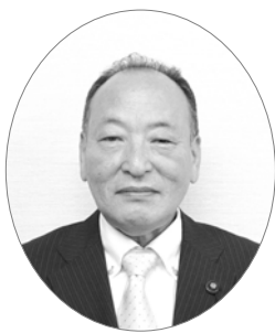
たけだに みつの 議員 竹谷 実

現在、設置プロジェクトやメンバーの選定を進めており、出来るだけ早い段階で立ち上げ、具体的な内容の検討を進めていく。