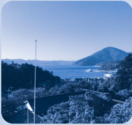
自宅からのオーシャンビュー！

私は別府で生活しています。昭和の時代に建築された住宅でとても趣があり昔ながらの雰囲気を感じさせてくれます。自慢したい点は窓を開けると山の間から海が一望できます！高級リゾートホテルにも負けないオーシャンビューが大好きです。フェリーも見えるのでみなさんの外も見守っています（笑）自己紹介というより家紹介になりました。