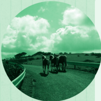
牛馬に注意してください！

て無い場合を思つとぞつとします（中学生の子供たちが自転車をよく走っているのを見ますが本当に凄いなと思います）。必至にこいでこいで、摩天崖駐車場までの所要時間はなんと40分！意外に早く着きました。自転車で行くと車ではゆっくり見ることのできない景色に出会えます。着いたときの達成感は何とも言えません。道中に牛馬がいるとすごく怖いのでそこは注意ですね。また下りは凄く速さになるので更に注意です。初めて行く人は看板があるとはいえこの道であつてるのかなと少し不安になるかもしれません。そんな不安を解消できるように窓口でしっかりと案内していきます。これから涼しくなってきましたので皆様もサイクリングをしてみませんか？