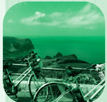
摩天崖からの景色です！

て無い場合を思つとぞつとします（中学生の子供たちが自転車をよく走っているのを見ますが本当に凄いなと思います）。必至にこいでこいで、摩天崖駐車場までの所要時間はなんと40分！意外に早く着きました。自転車で行くと車ではゆっくり見ることのできない景色に出会えます。着いたときの達成感は何とも言えません。道中に牛馬がいるとすごく怖いのでそこは注意ですね。また下りは凄く速さになるので更に注意です。初めて行く人は看板があるとはいえこの道であつてるのかなと少し不安になるかもしれません。そんな不安を解消できるように窓口でしっかりと案内していきます。これから涼しくなってきましたので皆様もサイクリングをしてみませんか？