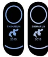
一般男女の参加者用に靴下を製作しました。なんと底面に滑り止め付きのスグレモノ！

横断幕の他にも、今回の島ランでは参加者の方にお配りする記念品も製作させて頂きました。