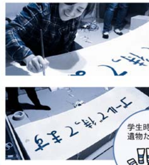
学生時代の遺物たち

横断幕の他にも、今回の島ランでは参加者の方にお配りする記念品も製作させて頂きました。