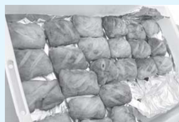
◀今回初登場！ 「いわがきパイ」