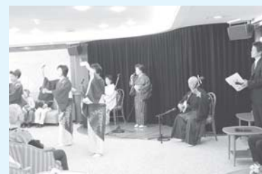
船内で披露された 隠岐民謡▶