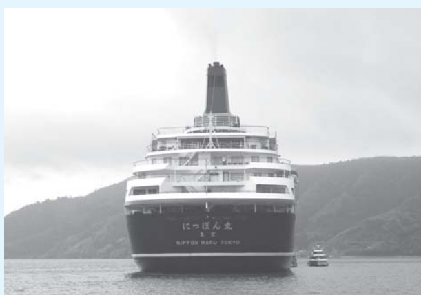
▲「にっぽん丸」総トン数22,472tのとても大きな船です。

今後も3隻の豪華客船の寄港が決定しており、6月2日「にっぽん丸」、9月22日「飛鳥Ⅱ」、10月6日「飛鳥Ⅱ」が寄港します。