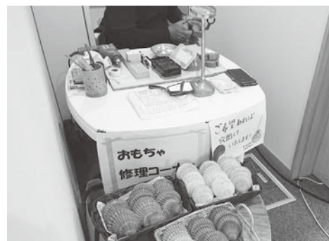
▲おもちゃ修理コーナー