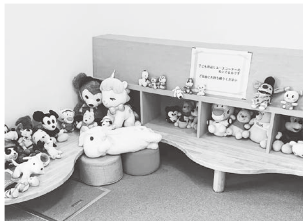
▲ぬいぐるみコーナー

子ども用品リユースコーナーに加え、おもちゃの修理コーナー、ハギレを使ったモノ作りも同時開催。