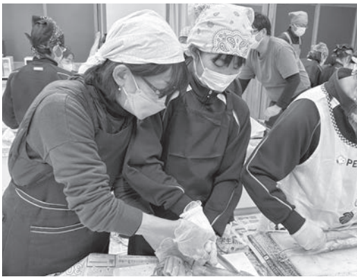
▲ 上手にさばくことができました