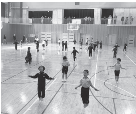
▲個人なわとびの様子

なわとび集会に際しましてたくさんの方の保護者のみなさまにお越しいただきました。ありがとうございました。