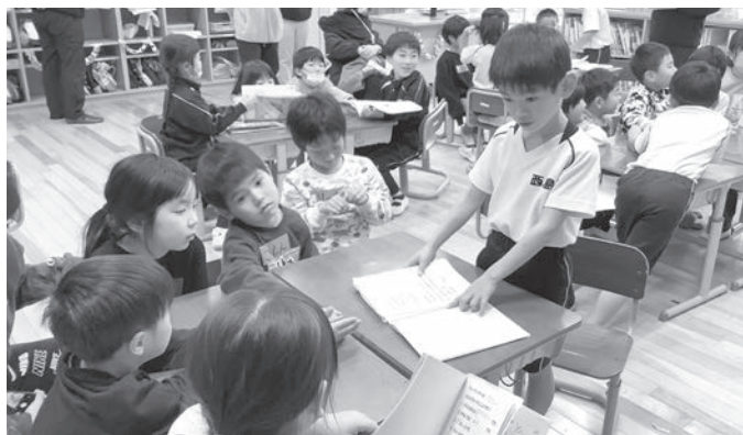
▲ 年長さんと楽しく交流しました

1年生は、本番に向けて、年長さんが学校のことを知るためのクイズや、教室の飾り付け、プレゼント作りなどたくさん準備を楽しみながら行いました。当日は、イベントだけでなく荷物置き場の案内や、司会進行、トイレの付き添いなど、役割分担をしながら年長さんのために進んで行動できました。やさしく声をかけながら生