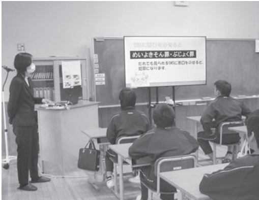
▲ 防犯教室の様子（小学6年生）

一般的なネットの危険性に併せて、子ども達を危険から守るためにネットを通じた子どもの性犯罪・性被害防止についても教えていただきました。現代生活においてネットは切っても切り離せない存在です。ネットとの上手な付き合い方について学ぶ機会となりました。