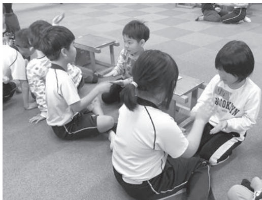
▲音楽の時間にわらべうたを学習しました