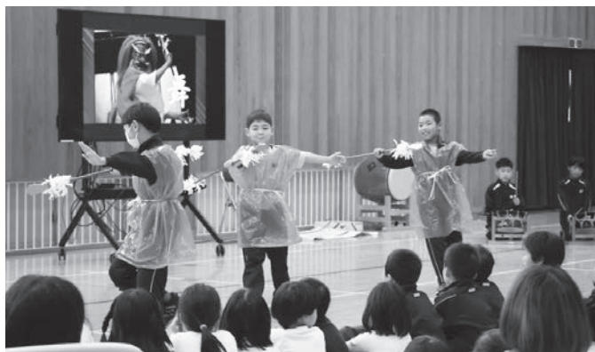
▲ 伝統を受け継ぐために