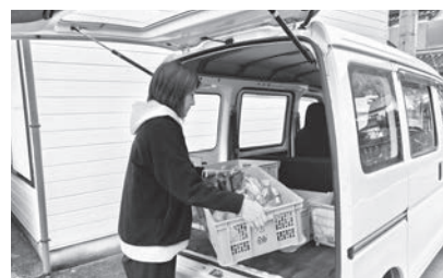
▲ 新鮮な状態でグリーンストアへ