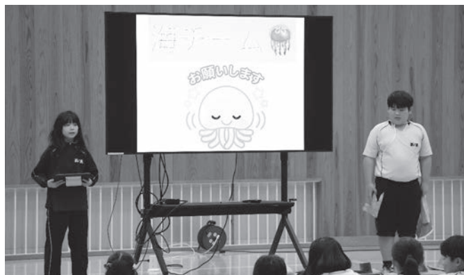
▲ 各チームの工夫が光った発表