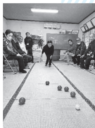
▲ 熱くなる体を使ったゲーム