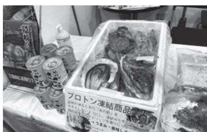
▲ 居酒屋ジャパン大阪に出展しました