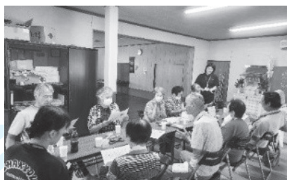
▲ 話題が絶えない茶話会の様子

令和6年度から、役場健康福祉課の開催する「いきいき健康サロン（体操・ゲーム・茶話会）」に同行し、集落支援員の活動範囲を広げています。各地区の皆さんとのコミュニケーションの場として、楽しいひとときを過ごすことができますので、お誘いあわせの上、ぜひお越しください。