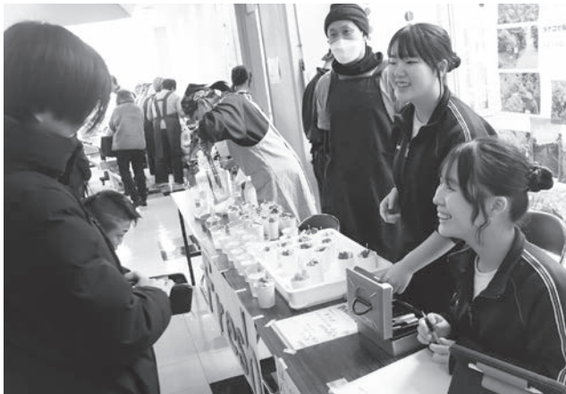
▲ 来場者と会話を楽しみながら、笑顔で接客する中学生