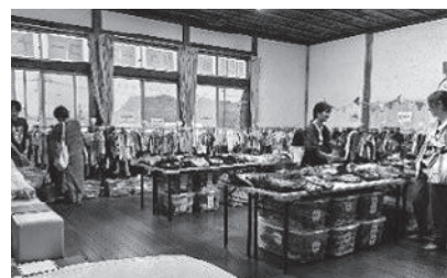
▲ 季節に合わせて用品を揃えています