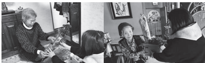
▲ 生産者さんから直接受け取ります。顔を合わせての会話も楽しいひととき。

地産地消のために、地元の方々が栽培された新鮮な果物や野菜を生産者さんに代わって、JAのグリーンストア内にある直売所へ出荷するお手伝いをしています。生産者さんの声掛けや見守りにもつながっており、いろいろなお話が聞けて集落支援員も元気をもらっています。