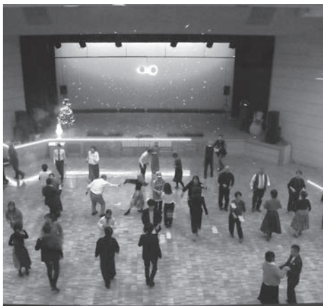
▲ 笑顔とにぎわいに包まれたノアホール