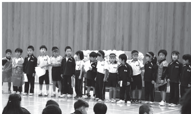
▲ 天までとどけ! 1年くじらぐも