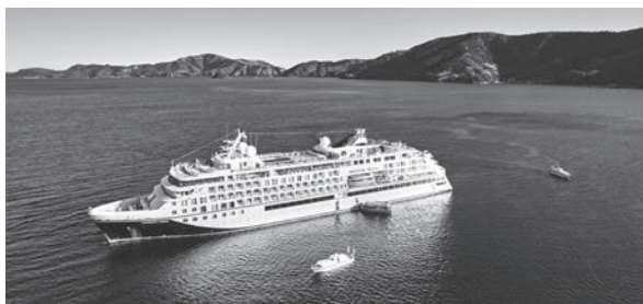
▲ 内海に浮かぶクルーズ船 (HANSEATIC nature)

MITSUI OCEAN SAKURA (日本船) 初寄港 - 三井オーシャンサクラ -