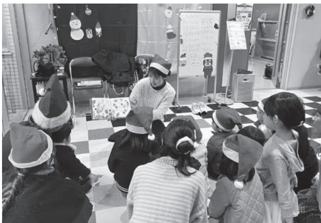
▲ 絵本の読み聞かせに、真剣に聞き入る子どもたち