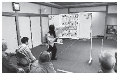
▲ 頭を使ったゲームは真剣になります