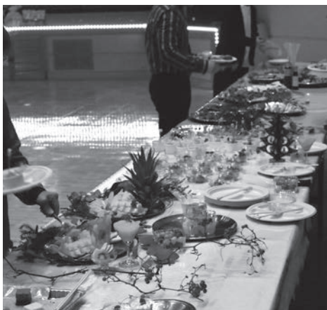
▲ 会場を彩った沢山の料理