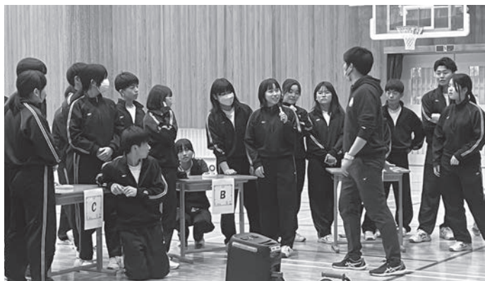
▲ クリスマスイベント（イントロクイズ）で盛り上がりました

また、ふるさと演劇で僕は照明担当でしたが、急ぎょ、野本役をやってくれないかと言われました。ただでさえ照明だけで大変なのに、と思いました。なかなかいいことだと考え、僕はすぐに「OKです」と言いました。セリフはすぐ覚えましたが、「う」っと倒れる場面が難しく、少し苦戦しました。しかし、みんなで一生懸命練習して、本番はしっかりできて良かったです。