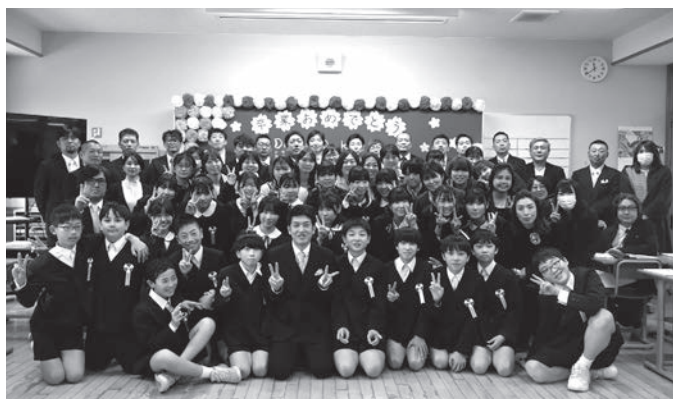
▲ 思い出いっぱいの教室で