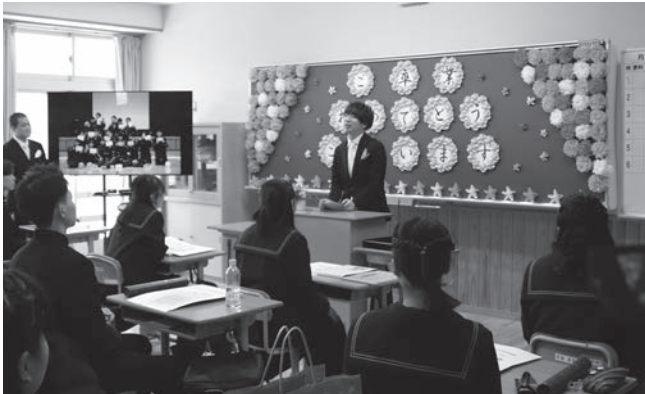
▲ 担任から卒業生へ

3月11日(水)、中学校の卒業証書授与式が挙行されました。来賓の皆様、保護者の皆様、そして小学校全校児童と中学校在校生が見守る中、卒業生16名一人一人が卒業証書をその手にしました。式後の学活では、3名の担任から、それぞれ「今を大切にしてください」「凡事徹底!」「あなたを必要とする人は必ずいる」という最後のメッセージに生徒たちは強くうなずい