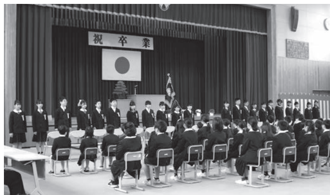
▲ 小学校を巣立ちます