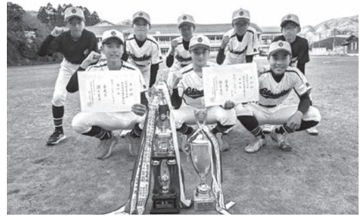
▲ 栄冠を手にした隠岐ベースボールクラブの選手

日頃よりチームを応援し支えてくださる地域の皆さまに、心より感謝申し上げます。今後とも隠岐ベースボールクラブ西ノ島支部へのご声援をよろしくお願いいたします。