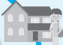
訪問看護ステーション