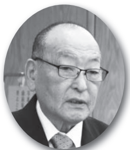
竹谷 実員 竹議

ことになると思う。海上輸送コストなど経費負担が重いため、町外に廃棄物処理をする者がいないという離島特有の事情はあるが、リユースの推進と併せ、ゴミの減量化に向けた意識啓発などに粘り強く取り組んでいく。