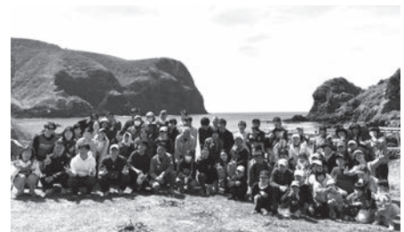
▲ 海岸清掃後の記念撮影