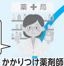
かかりつけ薬剤師