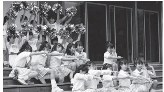
▲ 昨年のいかあやフェスでのステージイベント

詳しい内容は、ホームページやポスター、西ノ島チャンネル、SNSで順次ご案内します。ぜひチェックしてください。