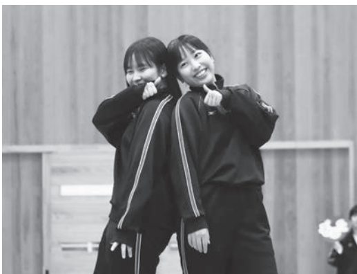
▲ 入場で決めポーズ!

私が3年生を送る会で一番大変だったことは、全校をまとめて動かすために自分はずいぶん何をしないといけないかと、どんな指示を出せばいいかを考えることです。その中で自分たちが楽しめる会ではなく、どういうことをすれば3年生が楽しんでくれるのかを考えながら動くのが大変でした。結果は、3年生の皆さんは楽しかったと言ってくれたけれど、本番で予期せぬハプニングがあったり、もっと準備しておけば上手かったと思ったりするところがたくさんあったので、来年の委員会活動に繋げていきたいです。