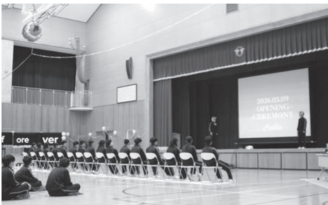
▲ 3年生のために心を込めて

スローガンは「Thank You Forever!」。3月9日(月)に3年生を送る会を開催しました。当日に至るまで、生徒会事務局を中心に、各委員会が全力を注いで、3年生に喜んでもらえるように準備に尽力しました。オープニングセレモニーをはじめ、絵描きサビトロや、思い出を振り返るクイズ、会場飾りつけや入退場、くす玉の作成など一人一人が協力し、全員で素敵な会を作り上げることができました。