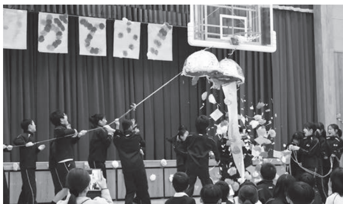
▲ 今までありがとう！