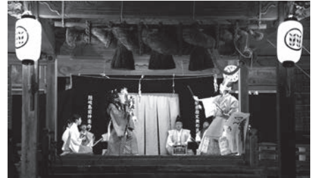
▲ 夜神楽公演の様子

これから夏にかけて観光で訪れる方も増えてまいります。訪れる皆さまを温かくお迎えできるよう、今後も取り組んでまいります。