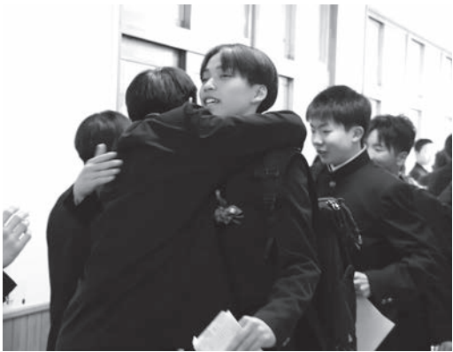
▲ 「がんばってください!」

ていました。見送りでは、同じ学舎で過ごした小学生、中学生と手を交わしたり、抱き合ったりと別れを惜しんでいました。春の訪れを感じさせる日和の中、温かな時間が過ぎ去りました。