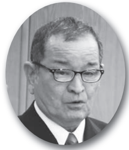
三角 久男 議員

な検討が必要。国は、今後ガイドラインの策定に向け、検討を始める予定であるが、現時点では明確な方針は示されていない。本町としては、国の動向を踏まえつつ実情に配慮しながら適切に対応を検討していきたい。