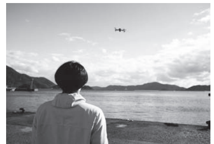
▲ ドローンを使用することもあります!