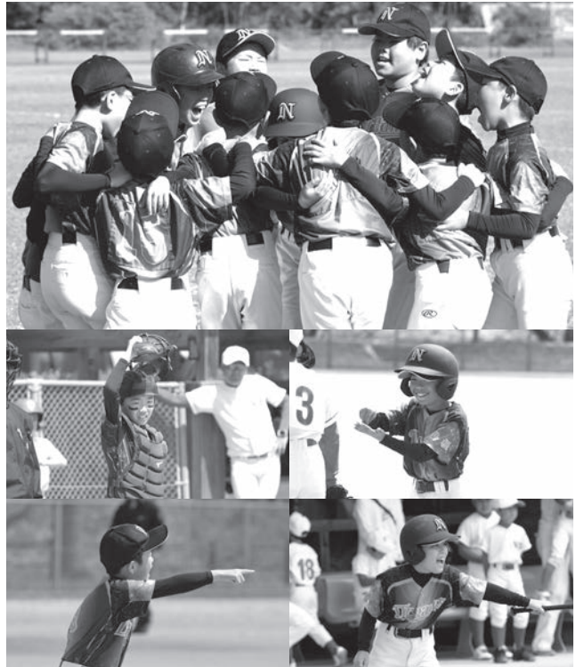
◀ 優勝を分かち合う選手たち

いつも温かいご声援を贈ってくださる地域の皆さまには感謝の気持ちでいっぱいです。今後とも西ノ島ドリームスへの応援をよろしくお願ひいたします。