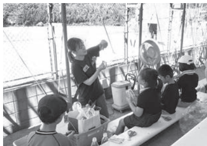
▲ ペットボトルロケット製作風景