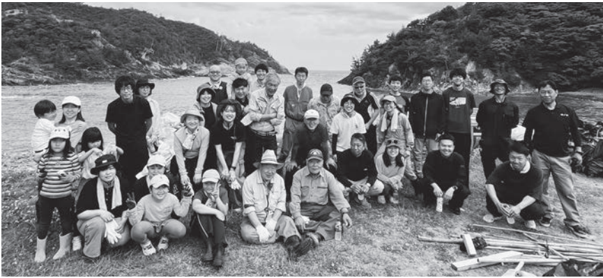
▲ ご協力ありがとうございました

6月7日(日)、本格的な夏を前に、多くの方々のご協力をいただきながら「耳浦海岸清掃活動」を実施いたしました。海岸に漂着したプラスチックごみや漁具、流木などを回収できました。美しい耳浦海岸を守るためご参加・ご協力いただいた皆さまに心より感謝申し上げます。