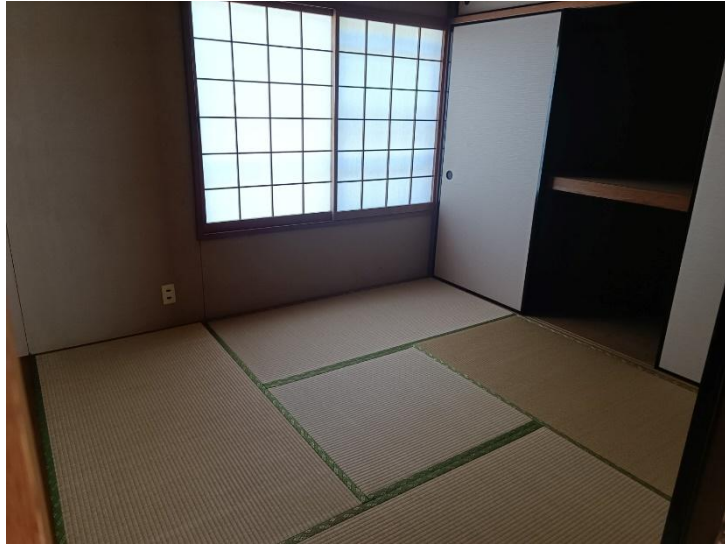
2階 (和室 4畳半)